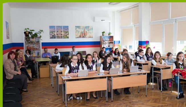
Кабинет руски език