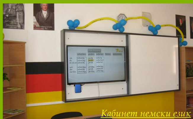
Кабинет немски език