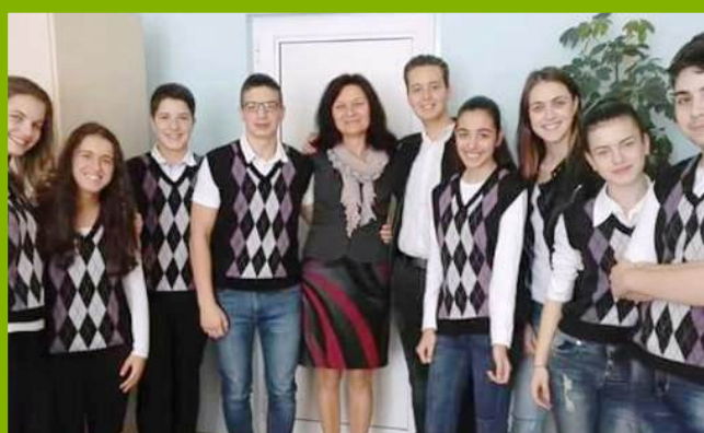
Ученически съвет Дейно участие в празниците

Учениците от училището масово участват и печелят призовите места в олимпиади, конкурси и състезания. Редовно нашите ученици и техните ръководители се включват в културните изяви на Общината.