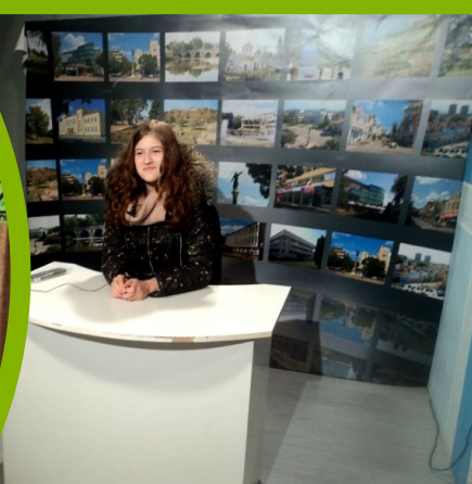
Клуб „Медиен свят“