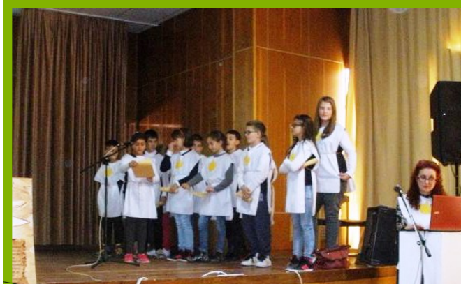
Клуб „Млади предприемачи“