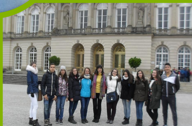
На гости в Германия