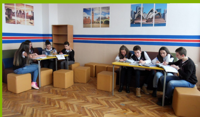
Кабинет английски език