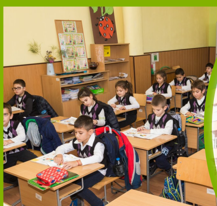
Кабинети в начален етап