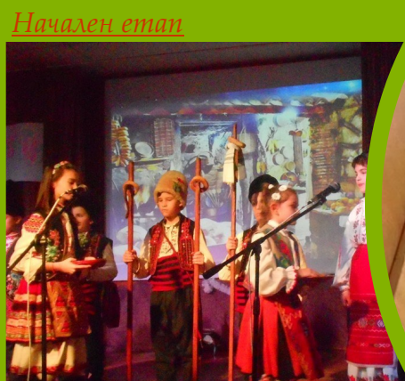
Начален етап Коледно тържество