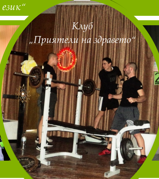
Клуб „Приятели на здравето“