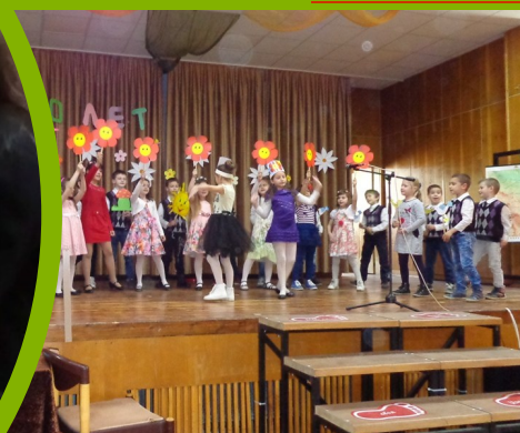
Начален етап Тържество. Първа пролет