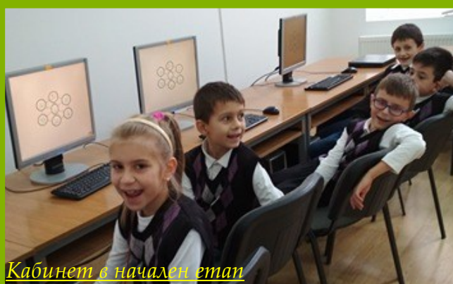
Кабинет в начален етап

Работим по национални и европейски проекти и програми, осигуряващи средства за реновиране и поддържане на МТБ.