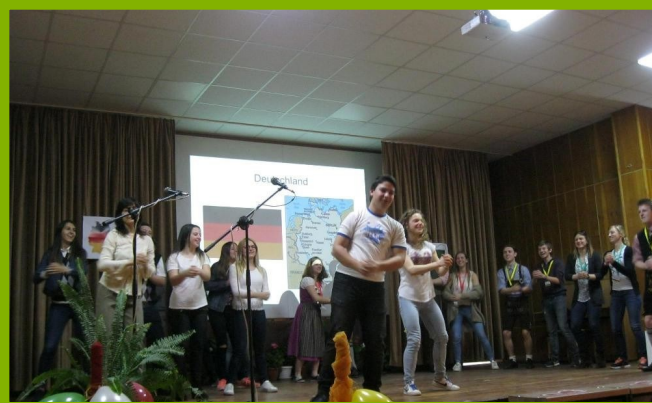
Гости от Германия. Шоу домакини