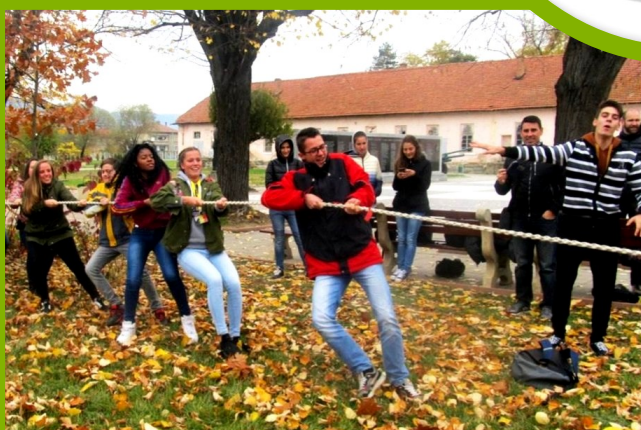
СУ „Васил Левски“ - домакин