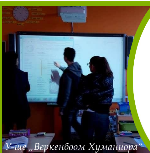
У-ще „Веркенбоом Хуманиора“