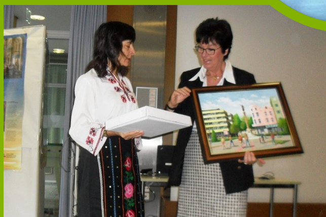
На гости в Германия