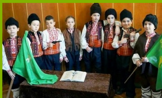
Начален етап Клетва. Репетиция за празника „Лъвче“