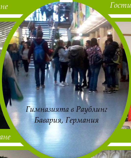
Гимназията в Раублинг Бавария, Германия