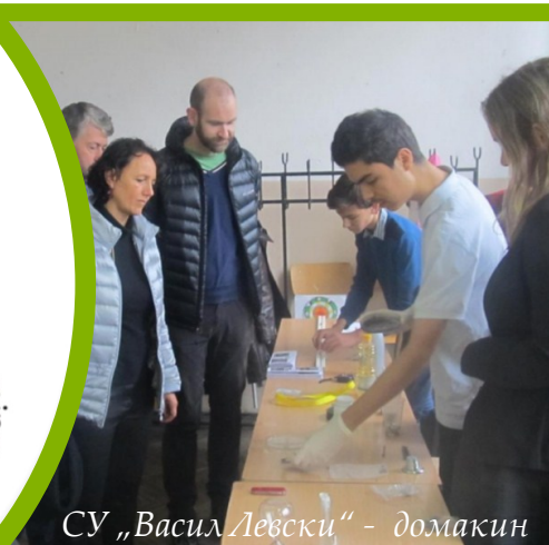
СУ „Васил Левски“ - домакин