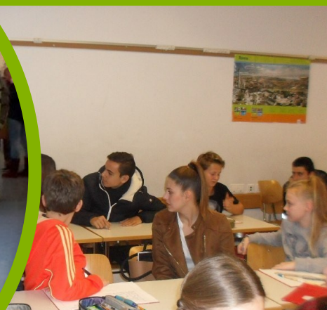
На гости в Германия