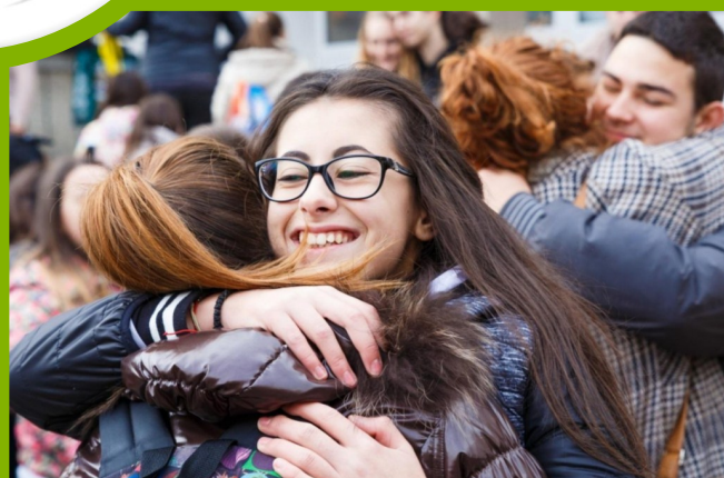
СУ „Васил Левски“ - домакин