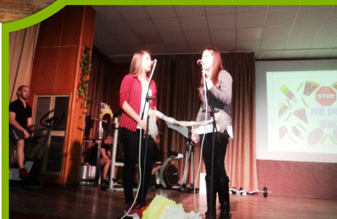
Музикален клуб „Шанс“