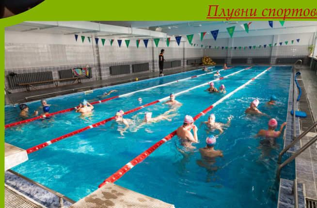
Плувни спортове Призови места за плувците ни