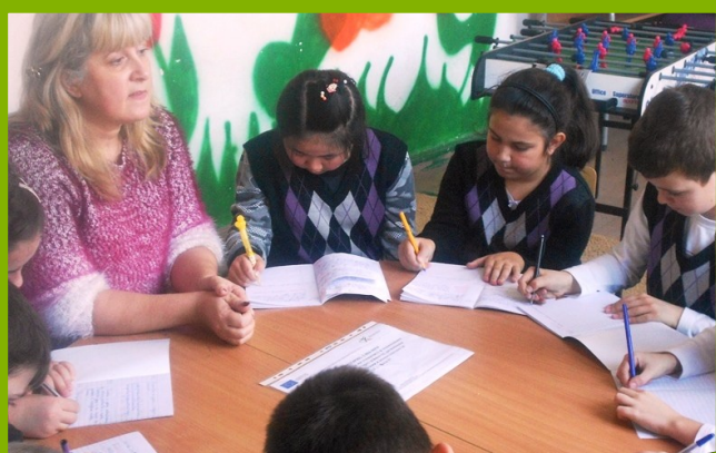
Клуб „Играя и уча Английски език“