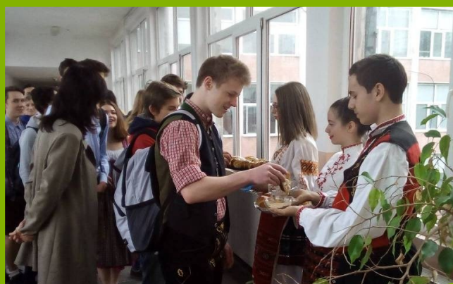
Гости от Германия. Посрещане

От 16.03.2018 до 22.03.2018 година СУ „Васил Левски“ ще посрещне отново учениците от Германия