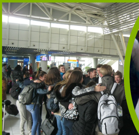
Гости от Германия. Изпращане