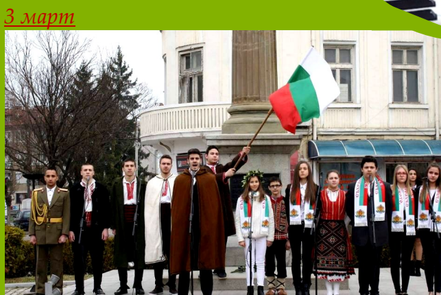
3 март Ежегодни участия в градското тържество