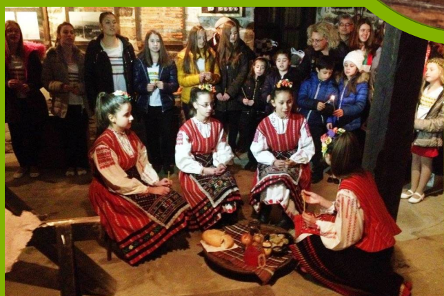
Музикална лаборатория „Традиции и сцена“